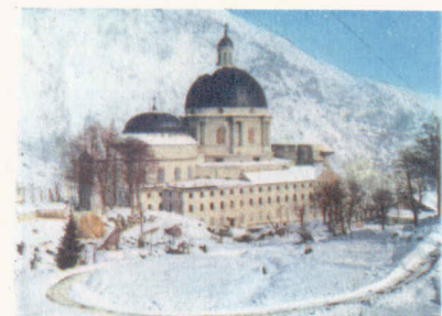
OROPA - MUCRONE