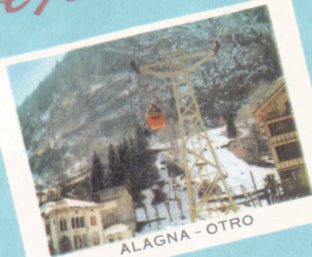
ALAGNA - OTRO