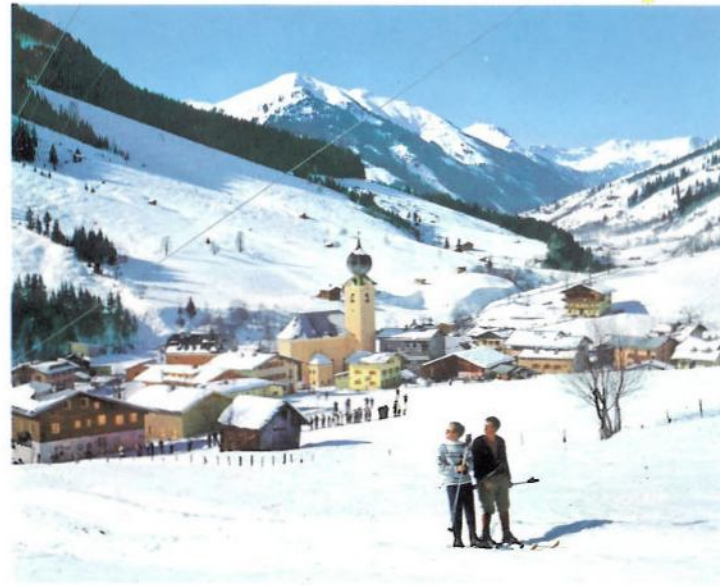
Alle Abfahrten führen zum Ort

M it der neuen Schattberg-Seilbahn und seinen 20 Skiliften (davon 4 in einer Höhenlage zwischen 1400–2100 Meter) bietet Saalbach dem Anfänger wie dem Köhner von Dezember bis Ende April bei bester Schneelage unbegrenzte Möglichkeiten. Durch die vielen Bahnen und Lifte keine Wartezeiten. Durch die ideale Südlage zahlreicher Abfahrten kommen die Gäste schon im Jänner sonnengebräunt ins Tal. Modernste Hotels, Gasthöfe und Pensionen oder Privatquartiere stehen dem Wintersportpublikum zur Verfügung, das sich bei abwechslungsreicher Unterhaltung im gemütlichen Skidorf aus aller Welt ein Rendezvous gibt.