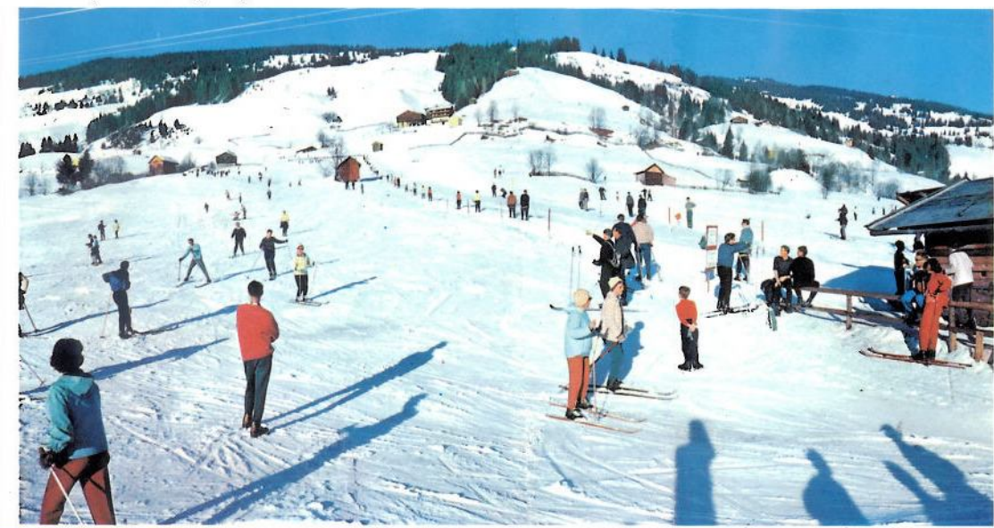
Beim Babylift am Übungshang

Saalbach is a very handy centre for Winter Sports, with its lovely surroundings and many skiing routes. Beginners and advanced skiers will find a wonderful choice of runs with excellent snow conditions as late as April. There are twenty ski-lifts and the "Schattberg-CABLE RAILWAY". Chair lifts will also take you straight from the village up to the mountains with their long runs and treeless slopes. Ideal weather with sunshine and with no south storms makes Saalbach an excellent winter holiday resort. Up to date hotels, inns, pensions, and privat apartments are at the disposal of winter guests who come here from all parts of the world.