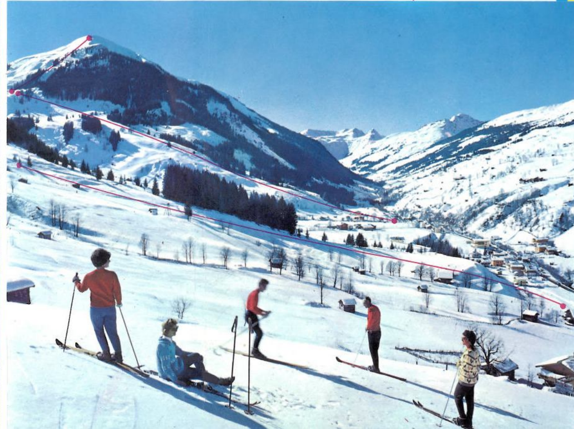
Am Zwölfer- und Bergfriedlift