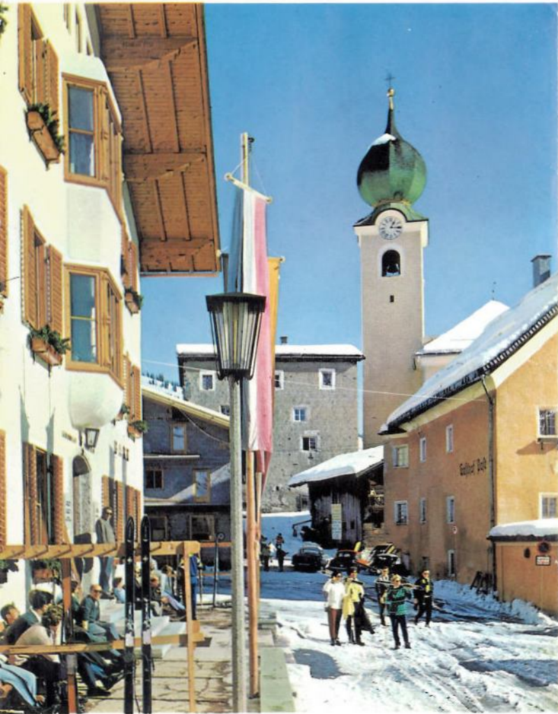
Der sonnige Treffpunkt am Ortsplatz

M it der neuen Schattberg-Seilbahn und seinen 20 Skiliften (davon 4 in einer Höhenlage zwischen 1400–2100 Meter) bietet Saalbach dem Anfänger wie dem Köhner von Dezember bis Ende April bei bester Schneelage unbegrenzte Möglichkeiten. Durch die vielen Bahnen und Lifte keine Wartezeiten. Durch die ideale Südlage zahlreicher Abfahrten kommen die Gäste schon im Jänner sonnengebräunt ins Tal. Modernste Hotels, Gasthöfe und Pensionen oder Privatquartiere stehen dem Wintersportpublikum zur Verfügung, das sich bei abwechslungsreicher Unterhaltung im gemütlichen Skidorf aus aller Welt ein Rendezvous gibt.