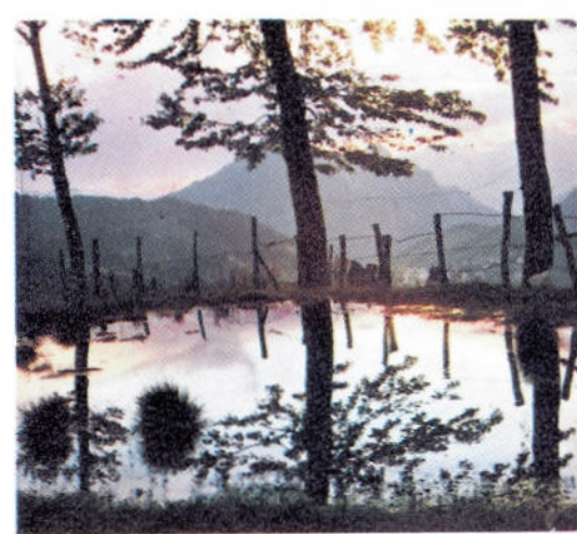
PICCOLO STAGNO SUL COLLE DI ZAMBLA ▲