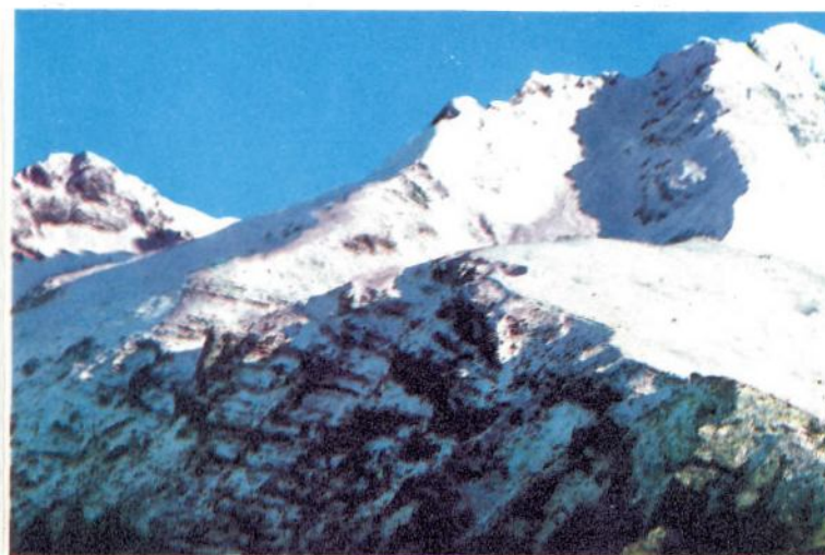
A cura dell'Associazione PRO-LOCO.