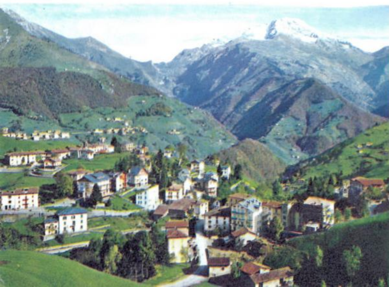
◀ PANORAMA VERSO L'ARERA

Ecco! Cercavate queste montagne e i boschi, i prati, i pascoli e paeselli come Oltre il Colle, Zorzone e Zambla! Per questa e per le prossime vacanze.