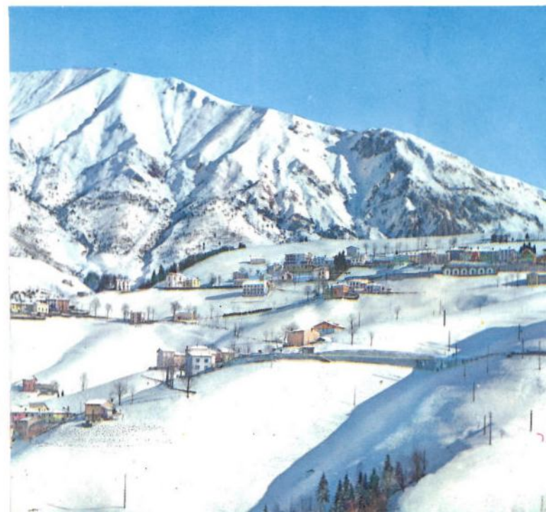
STAMPA "LITO RUBIS", CAPRINO BERGAMASCO