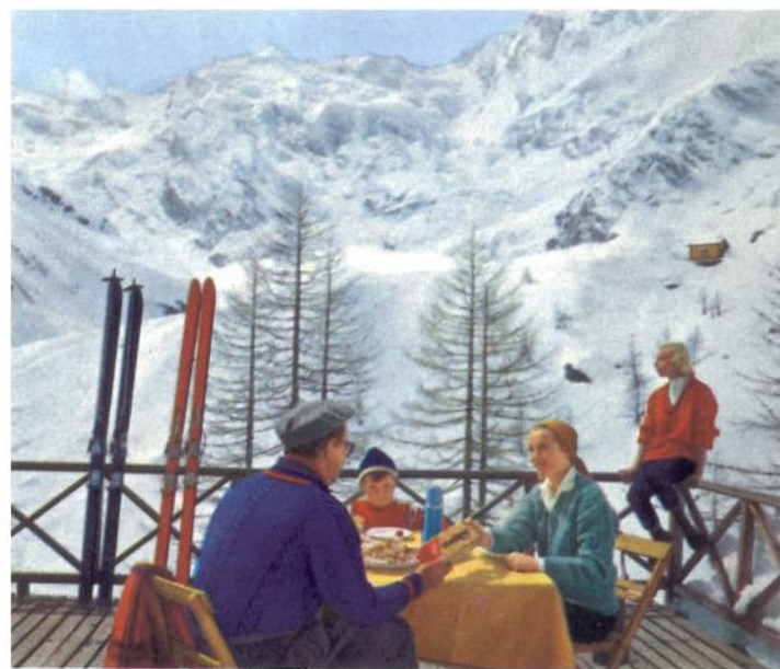
Terrazza al Belvedere