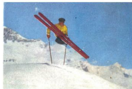
Sulla pista di Belvedere