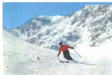
Discesa delle Morene