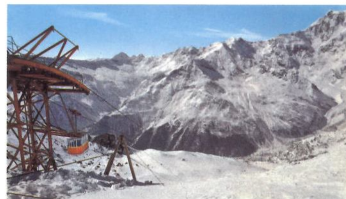
Funivia e piste del M.te Moro

Chiedete presso l'Azienda di soggiorno la grande Carta Topografica « Macugnaga e il M. Rosa » 1: 35 000.