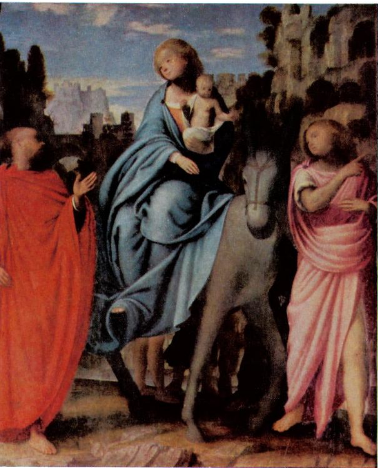
BARTOLOMEO SUARDI detto il BRAMANTINO

In the famous Sactuary of the Madonna del Sasso you can admire paintings by Bramantino, Luini and Ciseri.