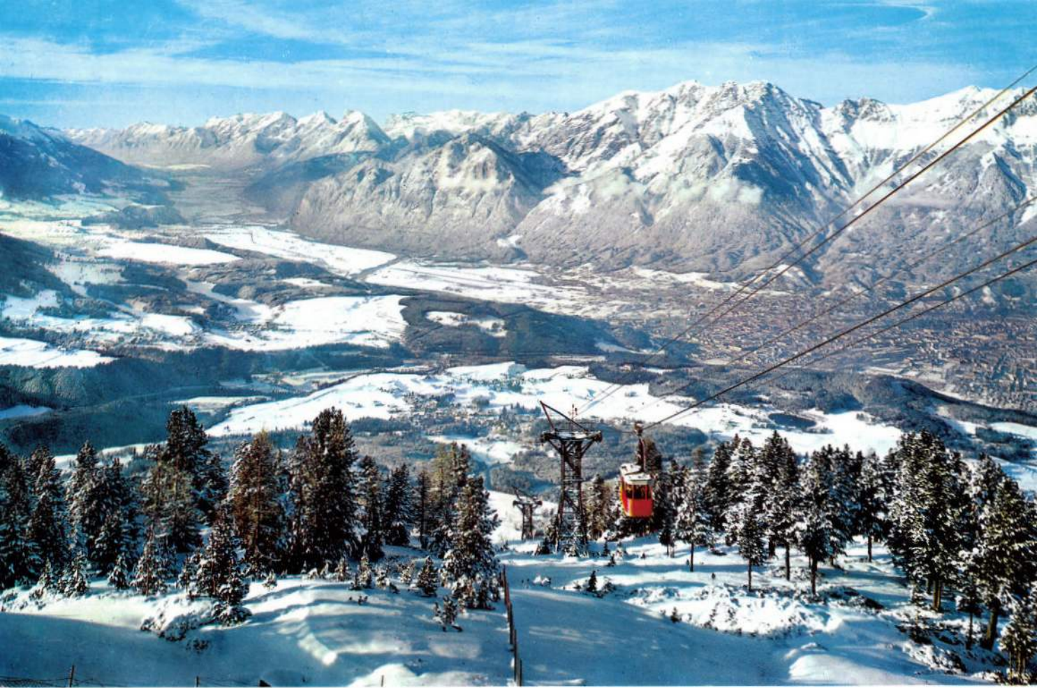
Blick vom Patscherkofel