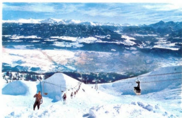
Blick auf Innsbruck