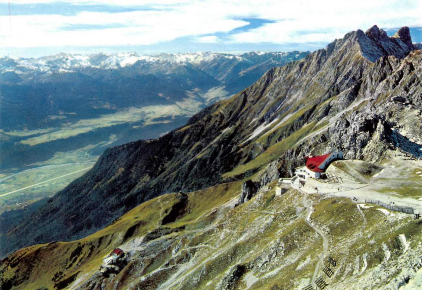
Hafelekar – Seegrube