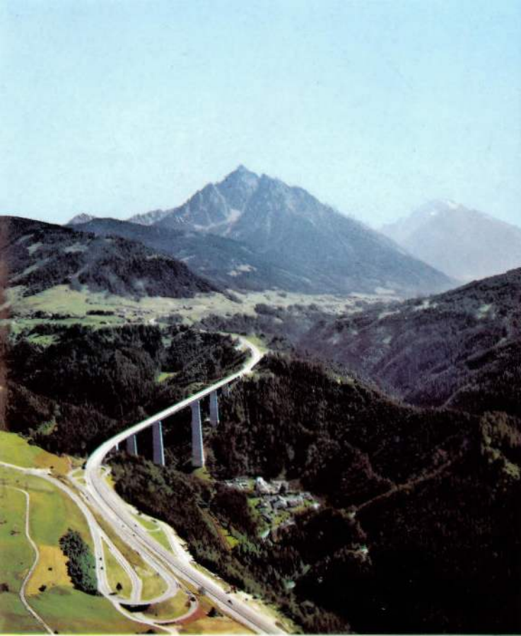
Europabrücke – Blick ins Stubaital