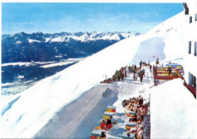
Seegrube - Terrasse