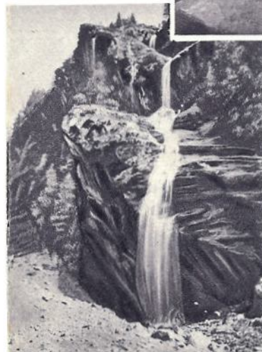
Scroscio di acque su rocce incombenti

Station d'été ed d'hiver dans l'haute montagne - Centre d'alpinisme de premier ordre - Station de sports d'hiver avec un moderne télésiège et skilift - De magnifiques champs de neige et des pistes à la portée de tout le monde. - Vue grandiose sur le Mont Rose. - Pendant 27 ans, séjour d'été de S. M. la Reine Marguerite, et actuellement du Président de la République Italienne, S. E. Einaudi.