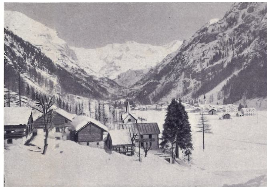
Villaggi dormienti in coltre nevosa