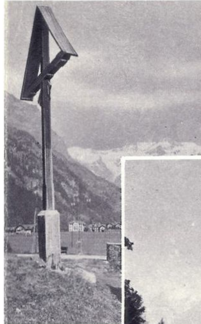
Il segno di Fede nell'immane creato