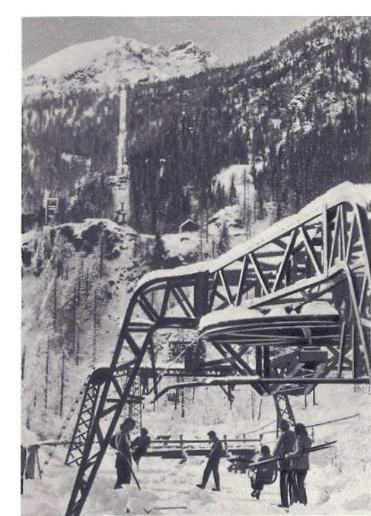
L'aerea via invita all'ascesa