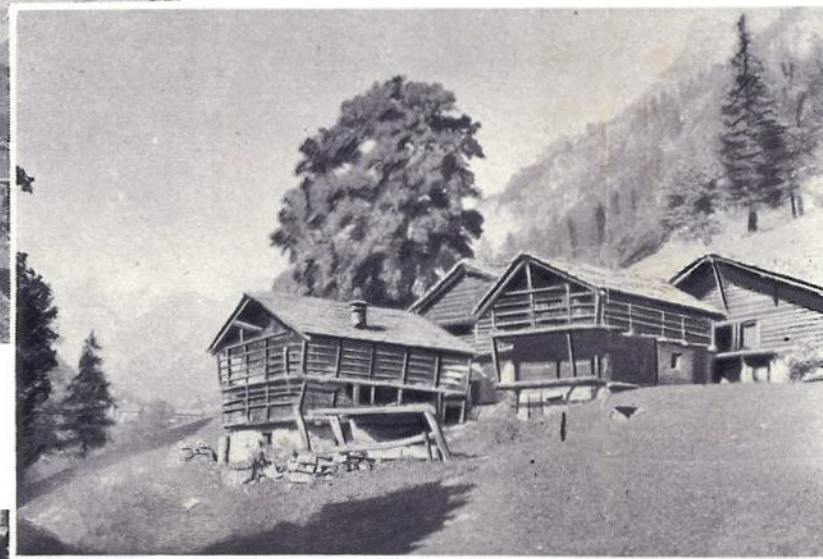
Sui prati fioriti le rozze magioni