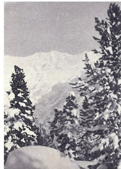
La candida pace nel sole splendente