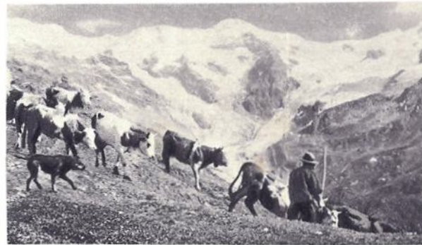
Muggiti di mandre splendore di ghiacci