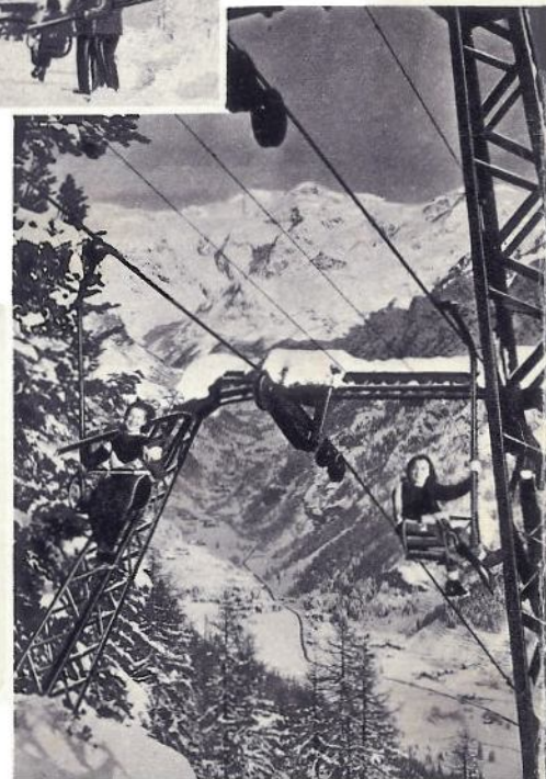
Ghiacciai scintillanti nell'incanto del sole