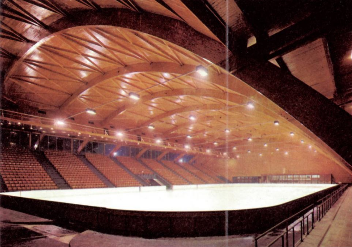
14 La Patinoire.

Par sa situation au cœur des Alpes, Grenoble était prédestinée à une vocation touristique et sportive. Ne le montra-t-elle pas en créant, en 1889, le premier de tous les syndicats d'initiative ?