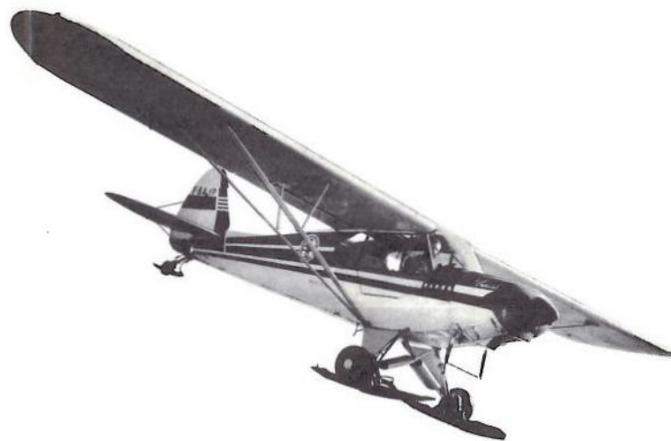
15 Le « Choucas », l'avion des neiges.