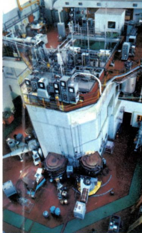
5 Centre d'Etudes Nucléaires MELUSINE, réacteur expérimental.

Entre cette Université et l'industrie grenobloise mille liens étroits ont créé une véritable symbiose.