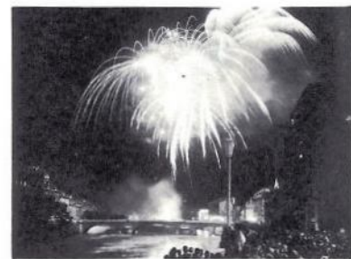
« 14 Juillet »