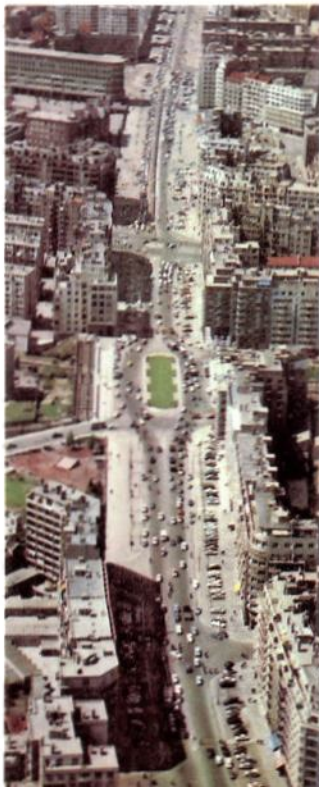
Grenoble... Ville pleine d'avenir. Carrefour des nouveaux boulevards