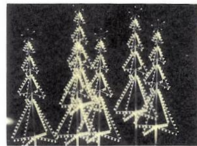
« Noël »