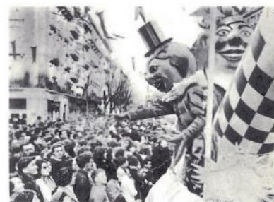
« Carnaval »