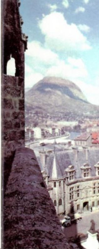
Grenoble... Ville chargée d'ans.