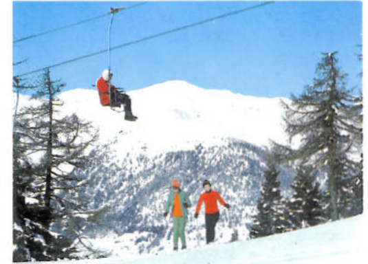
Sessellift Hühnerspielalm 1900 m Seggiovìa Malga Gallina