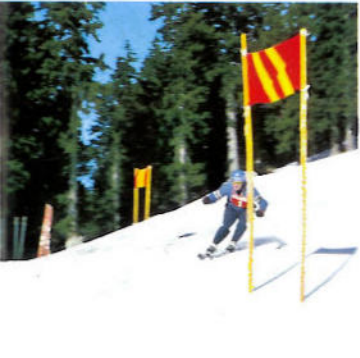
Skipiste am Hühnerspiel - Pista di sci a Malga Gallina