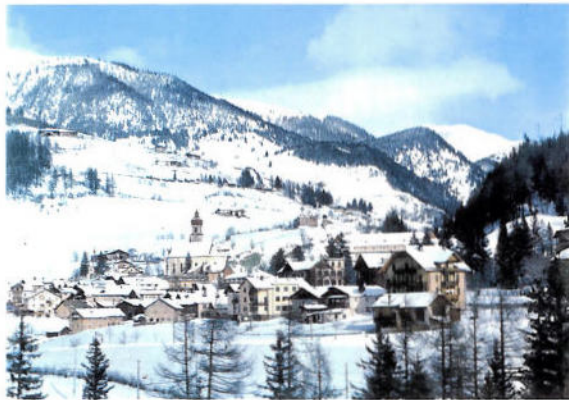
Gossensaß - Colle Isarco