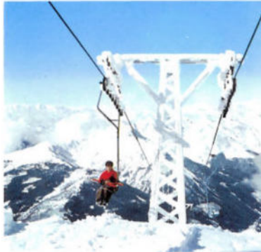
Sessellift Amthorspitze 2749 m Seggiovìa Cima Gallina