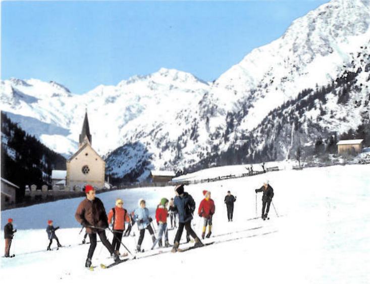
Innerpflersch mit Feuersteingletscher 1250 m