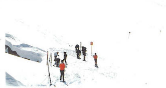
Weißspitze 2716 m Cima Bianca