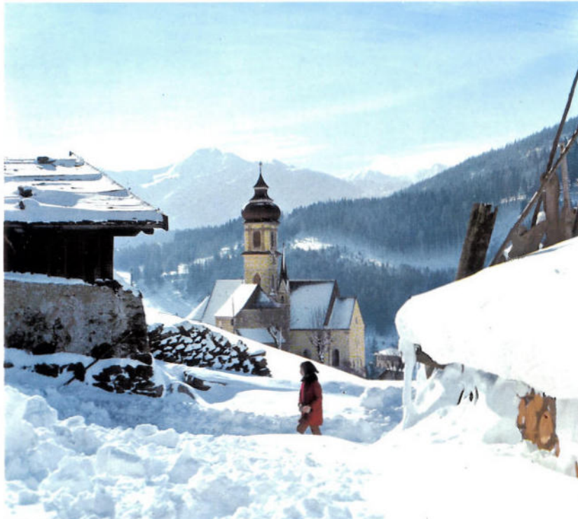
Gossensaß - Colle Isarco