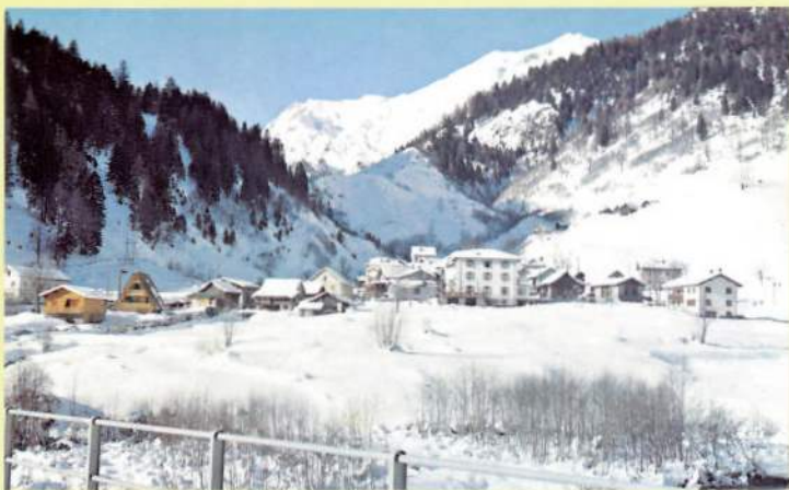
Veduta generale di Campo Blenio