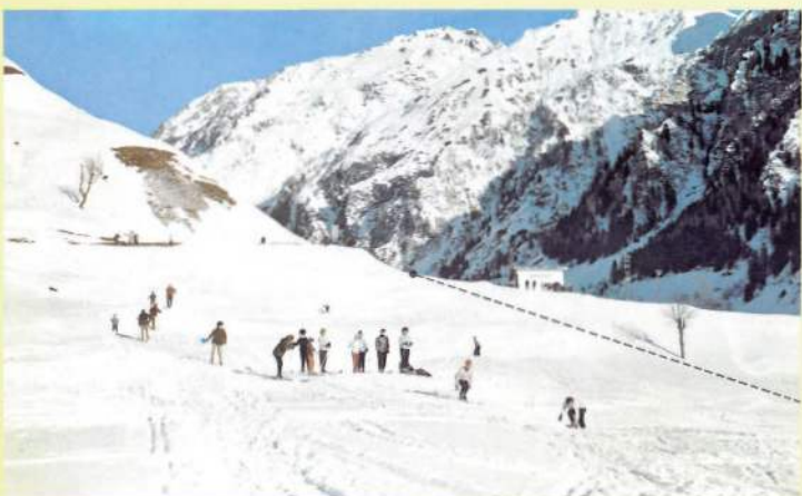
Piccolo sci-lift per principianti e Scuola Sci