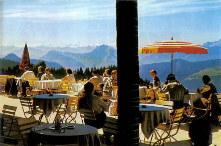
Terrasse des Berggasthofes mit Blick zum Großglockner