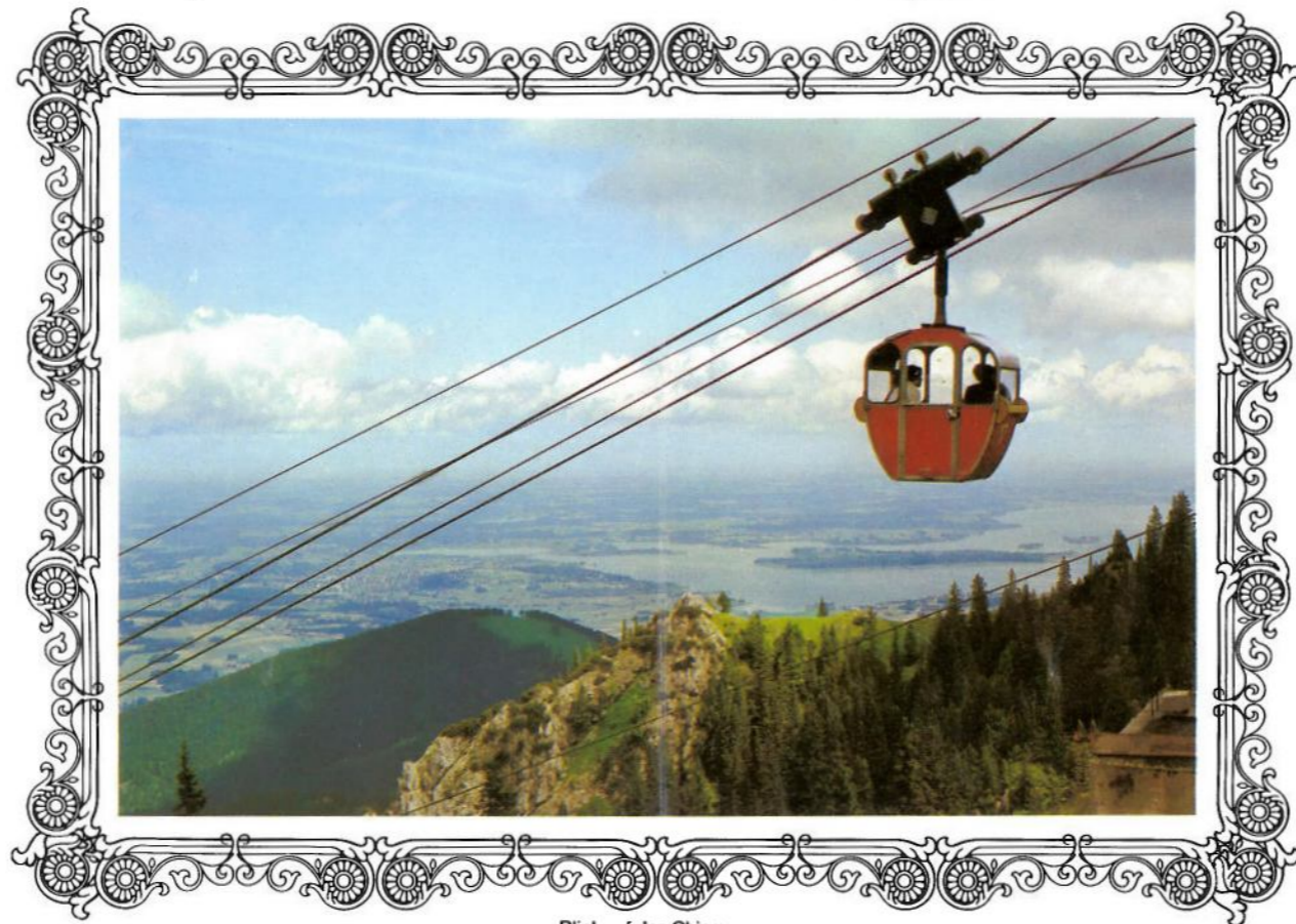
Blick auf den Chiemsee

Die Kampenwandbahn ist eine moderne Kleinkabinen-Umlaufbahn, die Sie sicher und bequem zur Bergstation bringt. Die Fahrt in den viersitzigen, rundverglaskten Kabinen ist ein vollendeter Genuß. Von der Bergstation führen herrliche Wanderwege über die Almen in viele Richtungen, und Sie können dabei die hochalpine Landschaft, die Höhenluft und Höhensonne genießen. Die Kampenwand ist der schönste Aussichtsberg des Chiemgauer (1669 m) und bietet Ihnen die herrlichsten Rundblicke auf die Zentralalpen mit den Hohen Tauern, dem Großglockner, Groß-